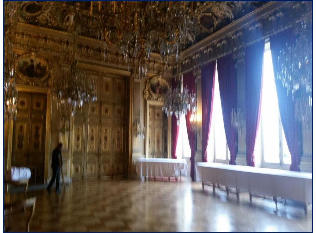
La salle de cocktail