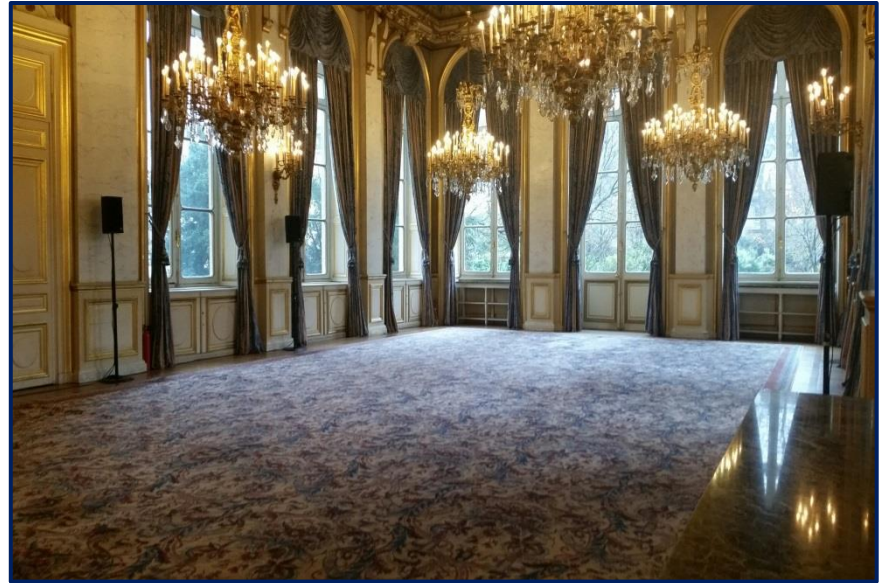
La salle de conférence du matin et d'échanges de l'après-midi