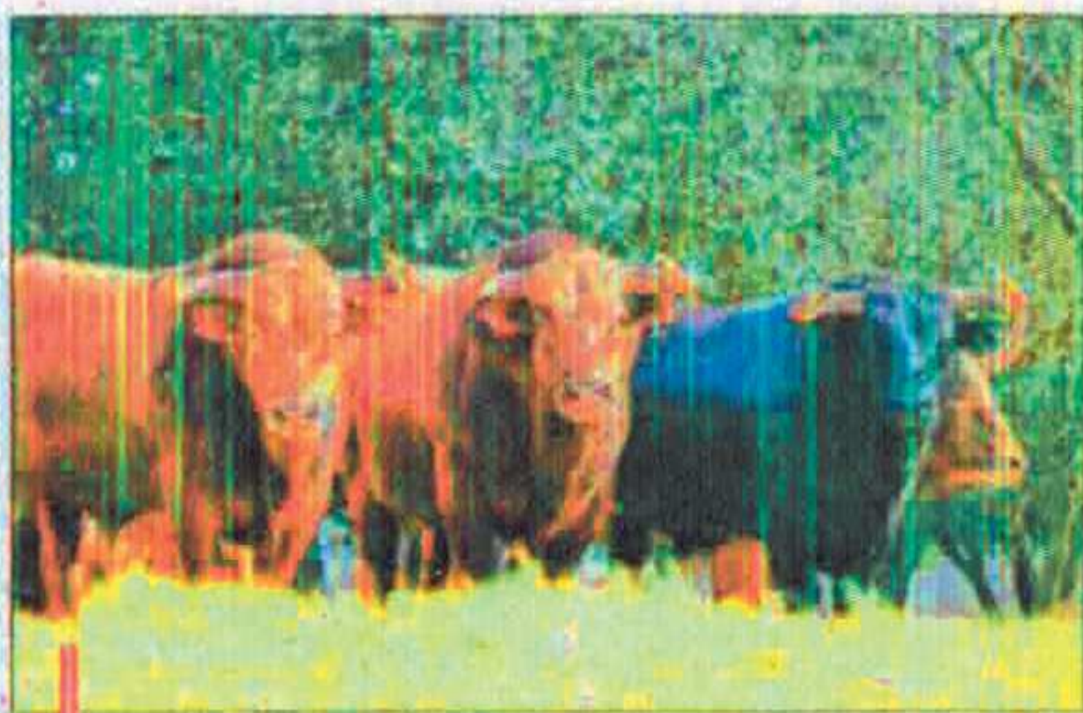
C'est la première fois que cet élevage réputé de Salamanque foulera le sable du Pallo.