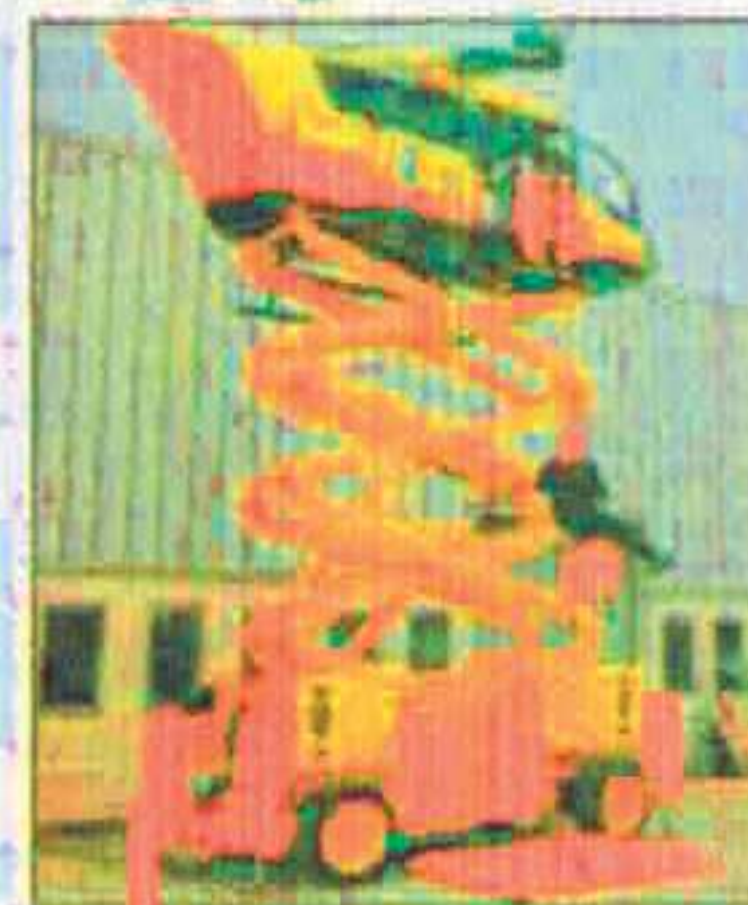
La découverte de l'hélicoptère.

Toujours impressionnantes, les formations dispensées chez VSM permettent notamment aux secouristes appelés à intervenir depuis un hélicoptère de découvrir cet environnement. Non seulement en s'entraînant à l'hélicoptère, mais aussi à s'extraire d'une cabine plongée dans l'eau à la suite d'un crash en mer. Dans ce cas, la répétition des bons gestes permettrait d'avoir de bons réflexes, comme celui de rester attaché jusqu'au contact avec l'eau... Certainement plus facile à écrire qu'à réaliser!